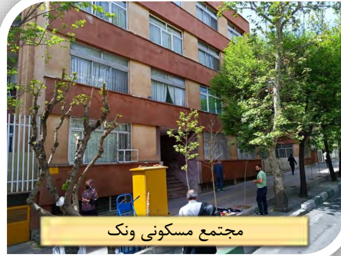
مجتمع مسکونی ونک