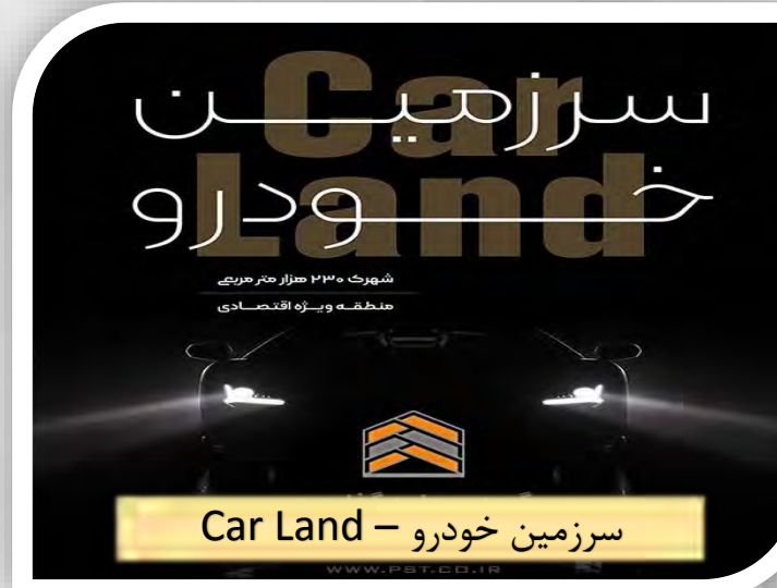
سرزمین خودرو - Car Land