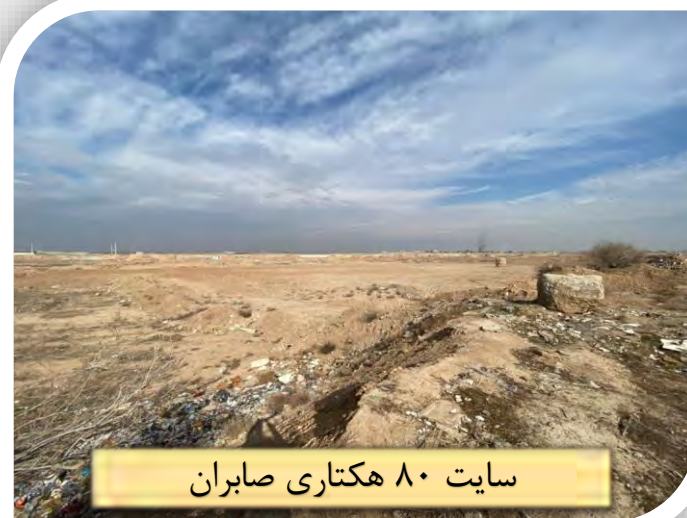
سایت ۸۰ هکتاری صابران