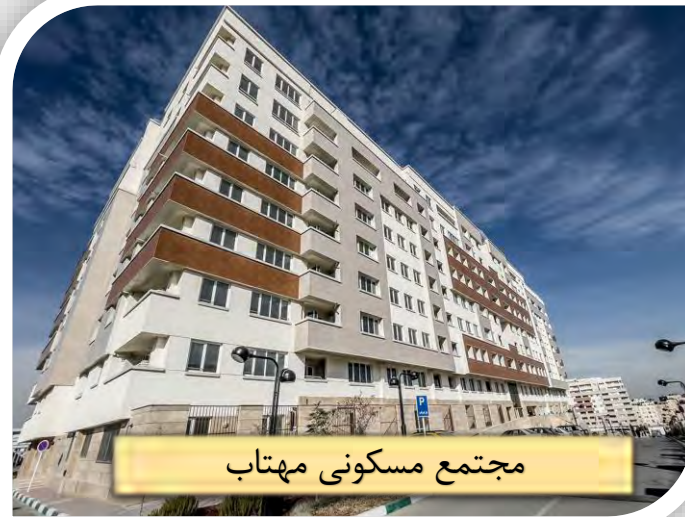
مجتمع مسکونی مهتاب