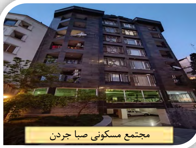
مجتمع مسکونی صبا جردن