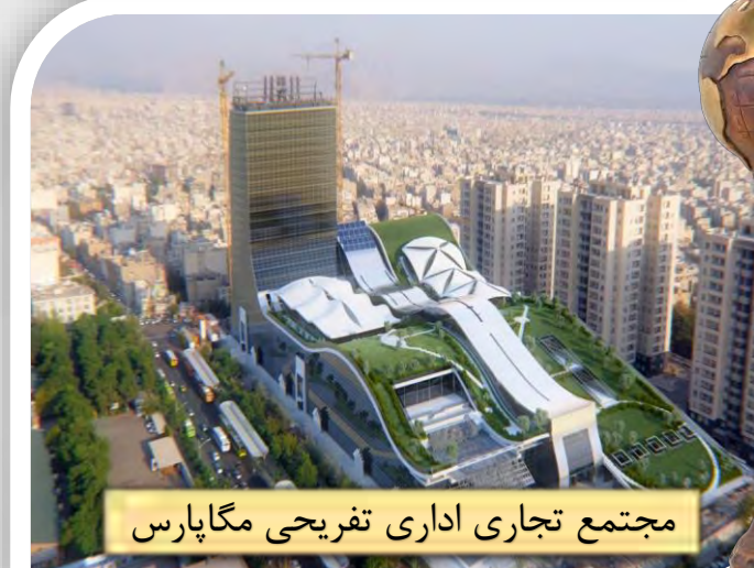
مجتمع تجاری اداری تفریحی مگاپارس