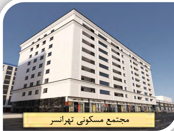
مجتمع مسکونی تهران سر