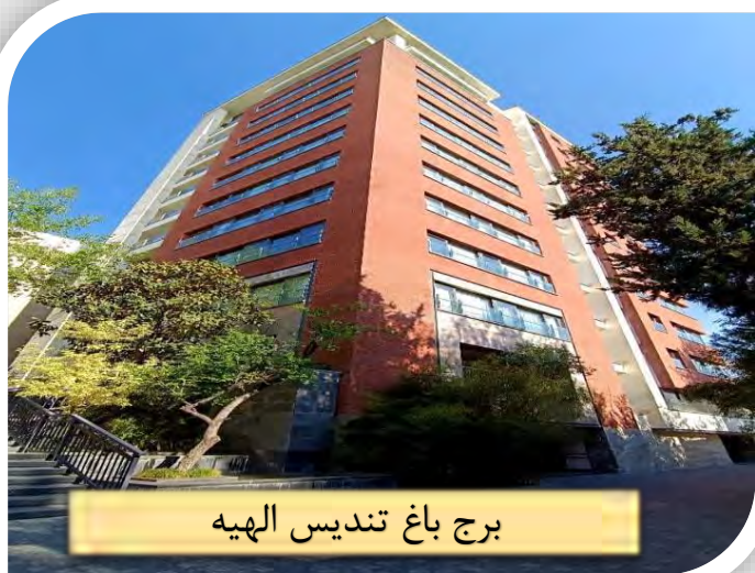
برج باغ تندیس الهیه