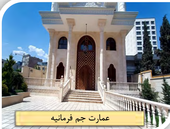
عمارت جم فرمانیه