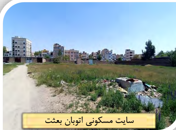
سایت مسکونی اتوبان بعثت