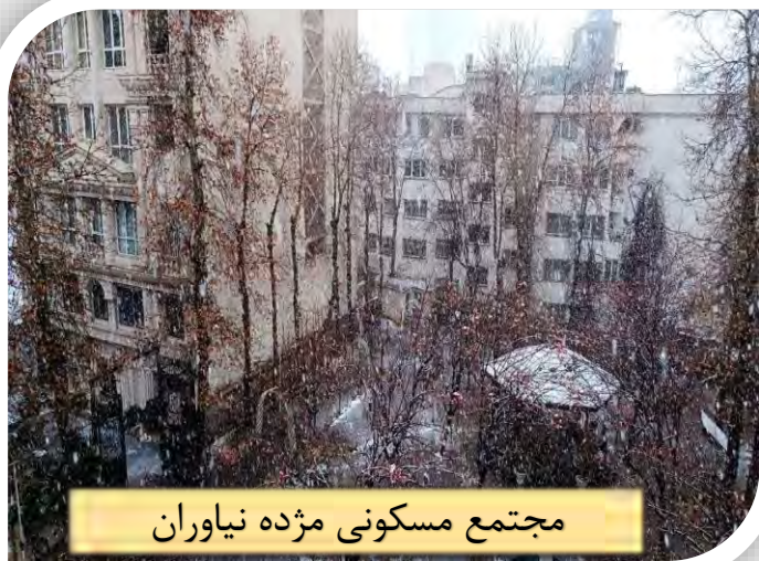
مجتمع مسکونی مژده نیاوران