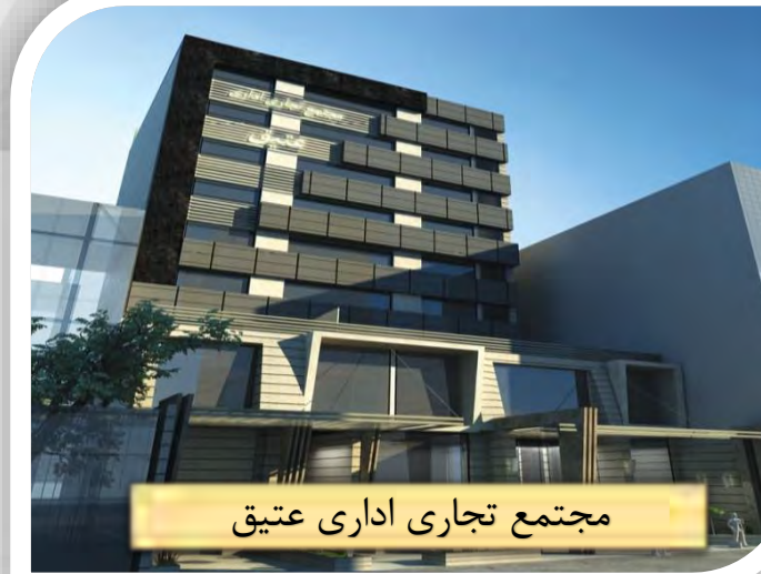
مجتمع تجاری اداری عتیق