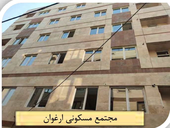
مجتمع مسکونی ارغوان