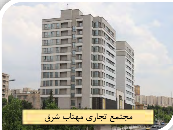
مجتمع تجاری مهتاب شرق