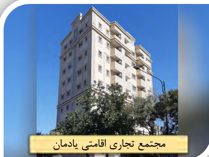
مجتمع تجاری اقامتی یادمان