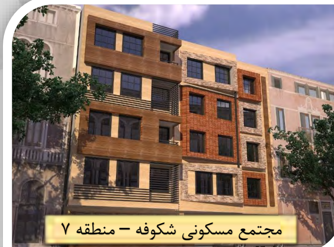
مجتمع مسکونی شکوفه - منطقه ۷