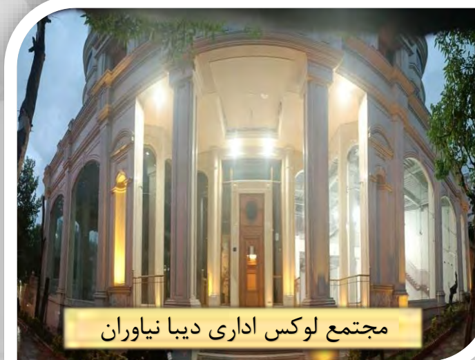
مجتمع لوکس اداری دیبا نیاوران