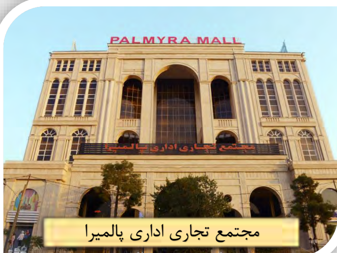
مجتمع تجاری اداری پالمیرا